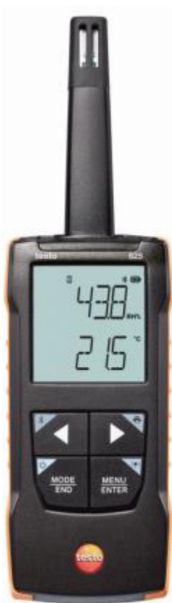
Рисунок 1 – Общий вид термогигрометра Testo 625